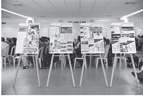
التصاميم المشاركة في المباراة

تصاميم حول التنظيم المدني والمعماري وأساليب التكامل المدني بين الأماكُن المبنية والإماكُن غير المبنية، إلى جانب مواضيع تتعلق بالتنمية المستدامة والصعوبات التي تشتمل عليها كتوفير الطاقة ومصادر الطاقة القابلة للتجديد، قدمها طلاب من كلية الفنون الجميلة والفنون التطبيقية في جامعة الروح القدس - الكسليك ضمن مسابقة بالتعاون مع منظمة الأونيسكو والمعهد الوطني للهندسة المعمارية في روما INARCH وبالتعاون مع مجلة Feuille International و Le Carré Bleu d'architecture International تحت عنوان «نداء عالمي للأفكار، فكرة لكل مدينة».